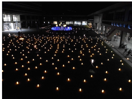
< 昨年の様子 >