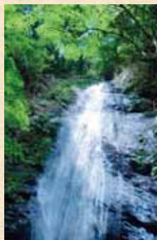
せいりい 蜻蛉の滝 (車で約10分)

「この里は丹生の川上ほど近し祈らば晴れば五月雨の空」と後醍醐天皇が歌に詠んだ由緒ある神社。675年、天武天皇の神宣によって創建されたと伝えられ、歴代天皇の崇敬あつく、水の神を祀っています。毎年10月に、例祭が行われています。