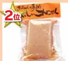
てっちゃんの手作りこんにやく(1丁) 420円

ほんのり甘く、軽い食感が特徴です。川上村の美しいお母さんたちが笑顔で作っています。