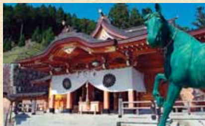
にうかわかみじんじやくあみしや 丹生川上神社上社 (車ですぐ)

「この里は丹生の川上ほど近し祈らば晴れば五月雨の空」と後醍醐天皇が歌に詠んだ由緒ある神社。675年、天武天皇の神宣によって創建されたと伝えられ、歴代天皇の崇敬あつく、水の神を祀っています。毎年10月に、例祭が行われています。