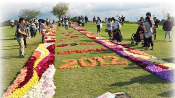
馬見フラワーフェスタ2012より