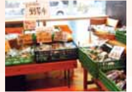
日本橋なら野菜市

また、東京日本橋の「奈良まほろば館」でも、毎週金曜日に「日本橋なら野菜市」を開催し、県産農産物の販売に力を入れています。さらに、来年3月に「幕張メッセ」で開催される国内最大の食品見本市「FOODEX JAPAN 2014」へ奈良県ブースの出展も予定。県産農産物のさらなる販路拡大に努めます。