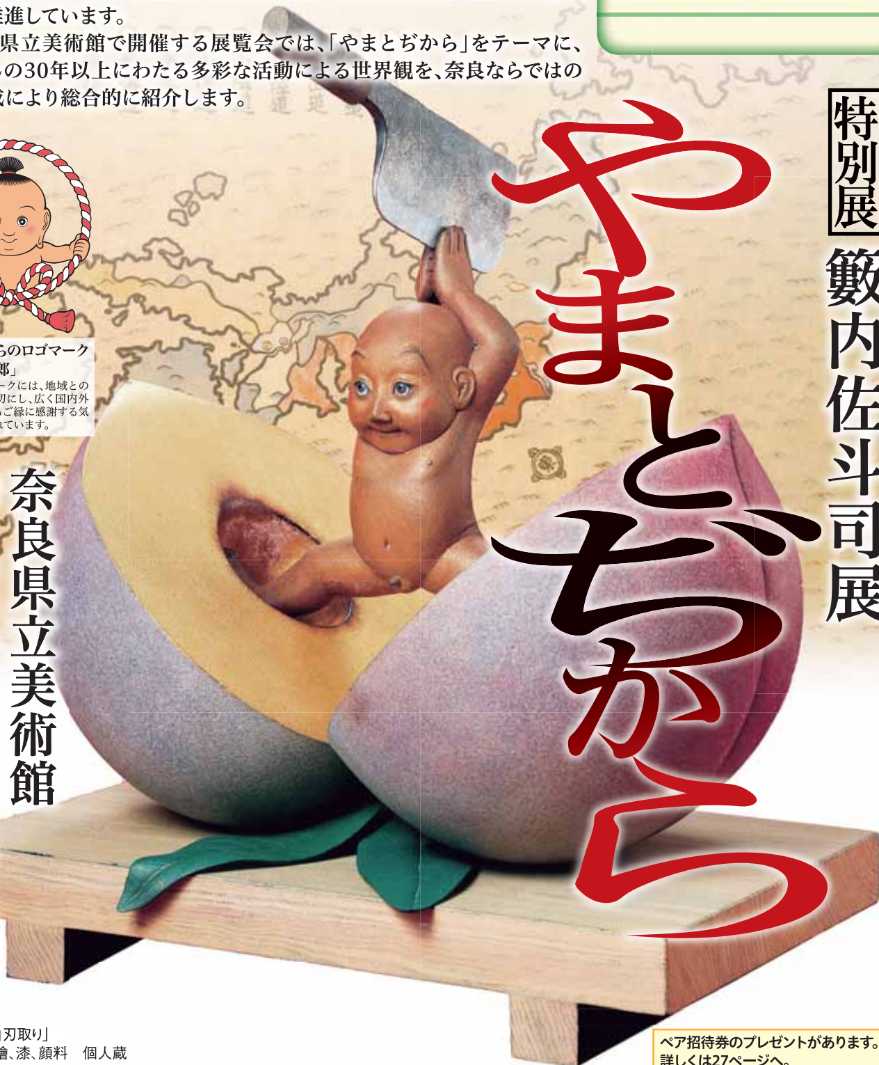
「桃太郎 白刃取り」 2008年 檜、漆、顔料 個人蔵

奈良県立美術館 10月19日(土)～12月15日(日) ※開館時間・観覧料等については、26ページの県立美術館をご覧ください。