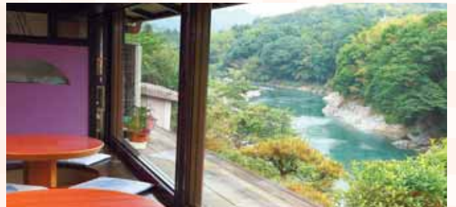
レストランよしの川/別館撫石庵

奈良県の素晴らしい「眺望」を眺めながら心地よい空間の中で、旬の味わい、地元産食材の滋味、旨みをお楽しみいただけるレストランを「眺望のいいレストラン」に認定。この秋には、あたらしいレストランも加わり、ますますパワーアップする予定です。