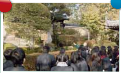
唐招提寺の見学。高校生が地元の知識を深めて、将来奈良の観光リーダーになることが期待されています。