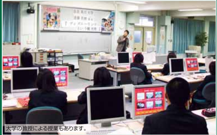
大学の教授による授業もあります。

県内で唯一、観光学を学べる奈良朱雀高校のこの学科では、旅行業界やホテル業界などから外部講師を招いたり、観光地を見学したりと、興味深い授業が盛りだくさんです。