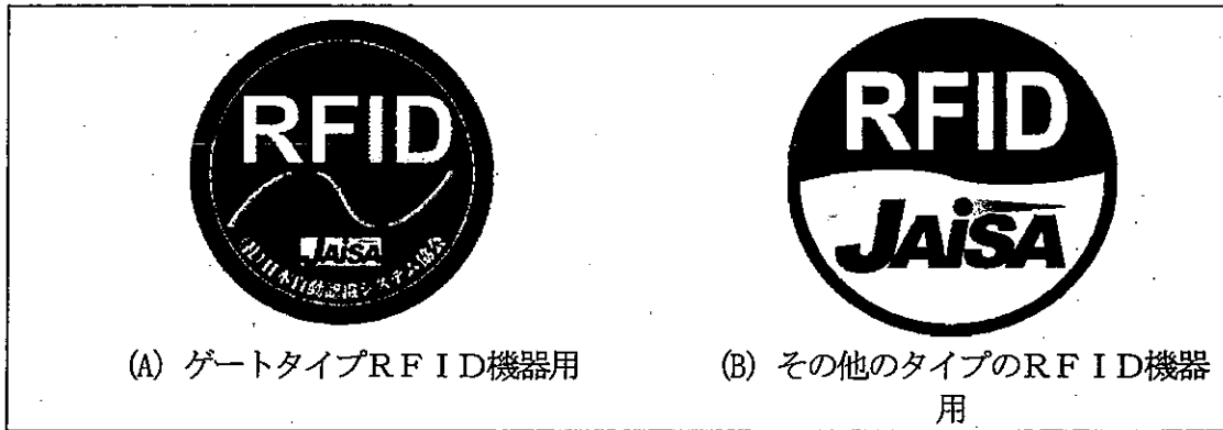
(A) ゲートタイプRFID機器用