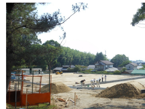
管理事務所新築工事進捗(7月現在)