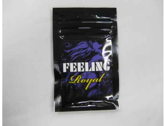
(4) FEELING ROYAL