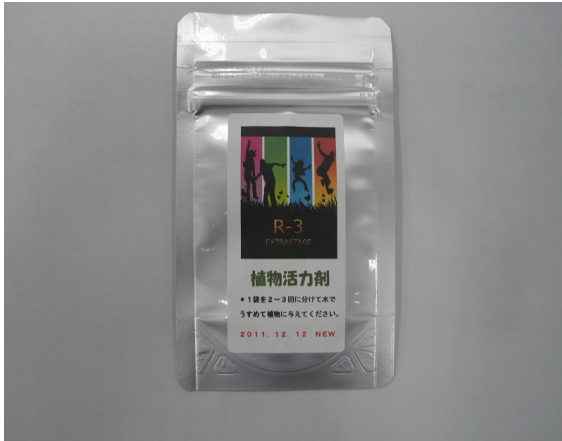
(3) R-3 EXTRASTAGE