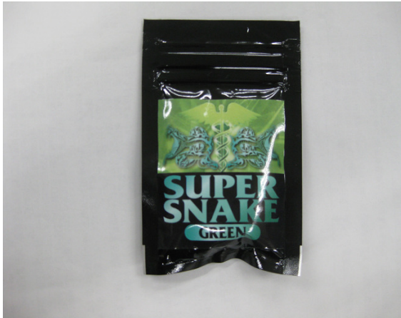
(5) SUPER SNAKE GREEN