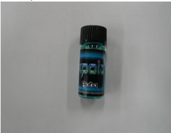
(1) Xpoiz Beta