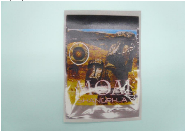
(1) MOAI SHANGRI-LA