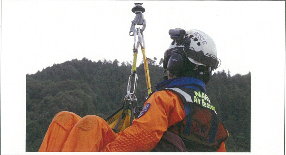
新規のEVスリングカラビナを使用してのPU。