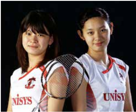
バドミントン選手(日本ユニシス所属)