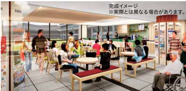
完成イメージ ※実際とは異なる場合があります。

「ほっと、一休み」できる「イートインコーナー」を併設した、利用しやすい魅力あふれるカフェがオープンします。世界中から訪れる人たちに、奈良公園周辺の観光情報収集の場として、また、憩いの場としてご利用いただけます。