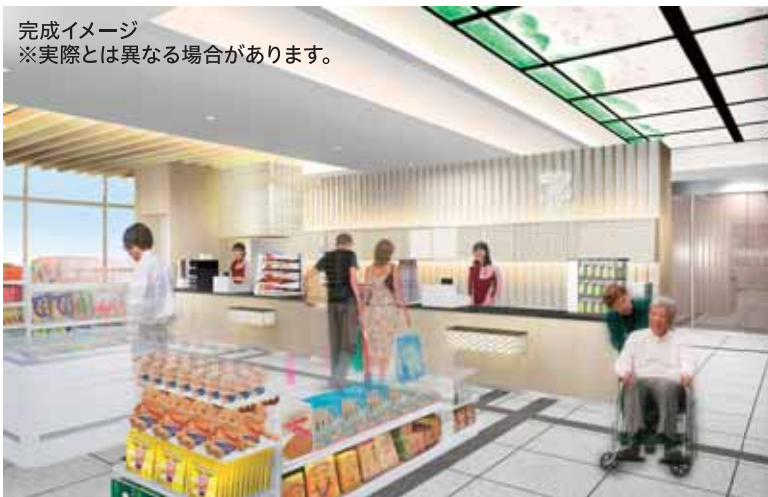
完成イメージ ※実際とは異なる場合があります。

県庁内にも「近くて便利」なセブン-イレブンがオープンします。セブン-イレブンオリジナル商品をはじめ、奈良県産商品を品揃えし、奈良県らしさをアピールする予定です。