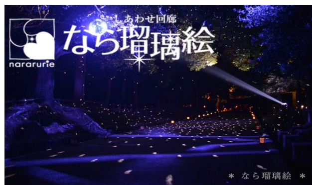
しあわせ回廊 なら瑠璃絵