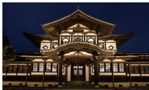
ライトアップ・プロムナードなら