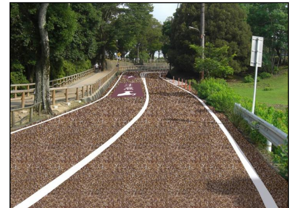
カラー舗装(イメージ)