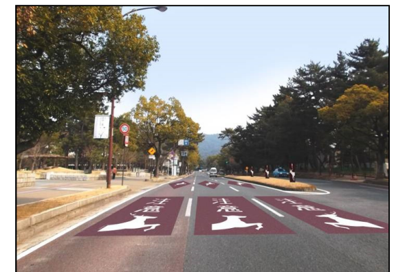
路面標示(イメージ)