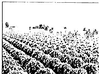
チリのプチヴェール畑

プチヴェールは、ケールとメキャベツのかけ合わせによって生まれた新しい野菜です。日本で生まれましたが、カゴメはチリでの大規模栽培にも成功しました。