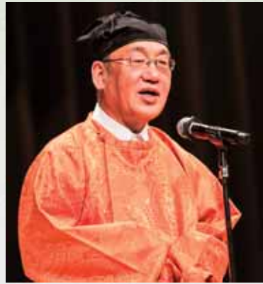
官服姿で挨拶する荒井知事

1月18日、東京で首都圏記紀シンポジウムが開催され、約750人が参加しました。県では、古事記完成1300年の記念年である2012年から、日本書紀完成1300年の記念年である2020年までの9年間、「記紀・万葉プロジェクト」を推進しています。このシンポジウムは、記紀の歴史性、文化性、国際性などを見つめ直す機会としていただけるようにと行われたものです。