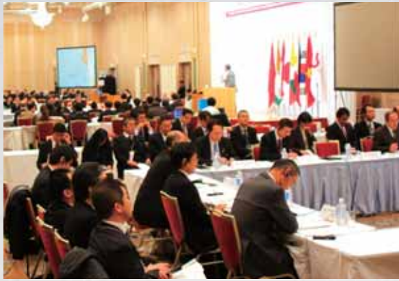
国内からも県知事や市町村長等が多数参加した会合