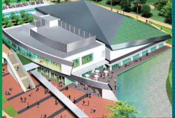
スイムピア奈良(外観)完成イメージ

県民の皆さんに親しみを感じてもらえるように、名称を公募し、公園が「まほろば健康パーク」、新県営プールが「スイムピア奈良」になりました。