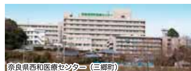
奈良県西和医療センター (三郷町)