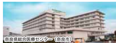
奈良県総合医療センター (奈良市)

A 医療サービスについては、今まで県立病院が行ってきた公的な医療サービスを継続し、より質の高い医療を提供していきます。病院の場所は今までと変わりませんが、「奈良県総合医療センター」は、平成28年度中の完成を目指し、奈良市平松から六条山地区への移転整備を進めています。