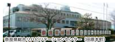
奈良県総合リハビリテーションセンター (田原本町)