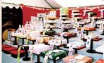
全国から奉納された饅頭

林神社では毎年、林浄因の命日である4月19日に「饅頭まつ り」が開催されます。全国各地から献上された饅頭がひな壇に 供えられ、祭 りの最後に は、参拝者に その場で蒸さ れた饅頭がふ るまわれます。