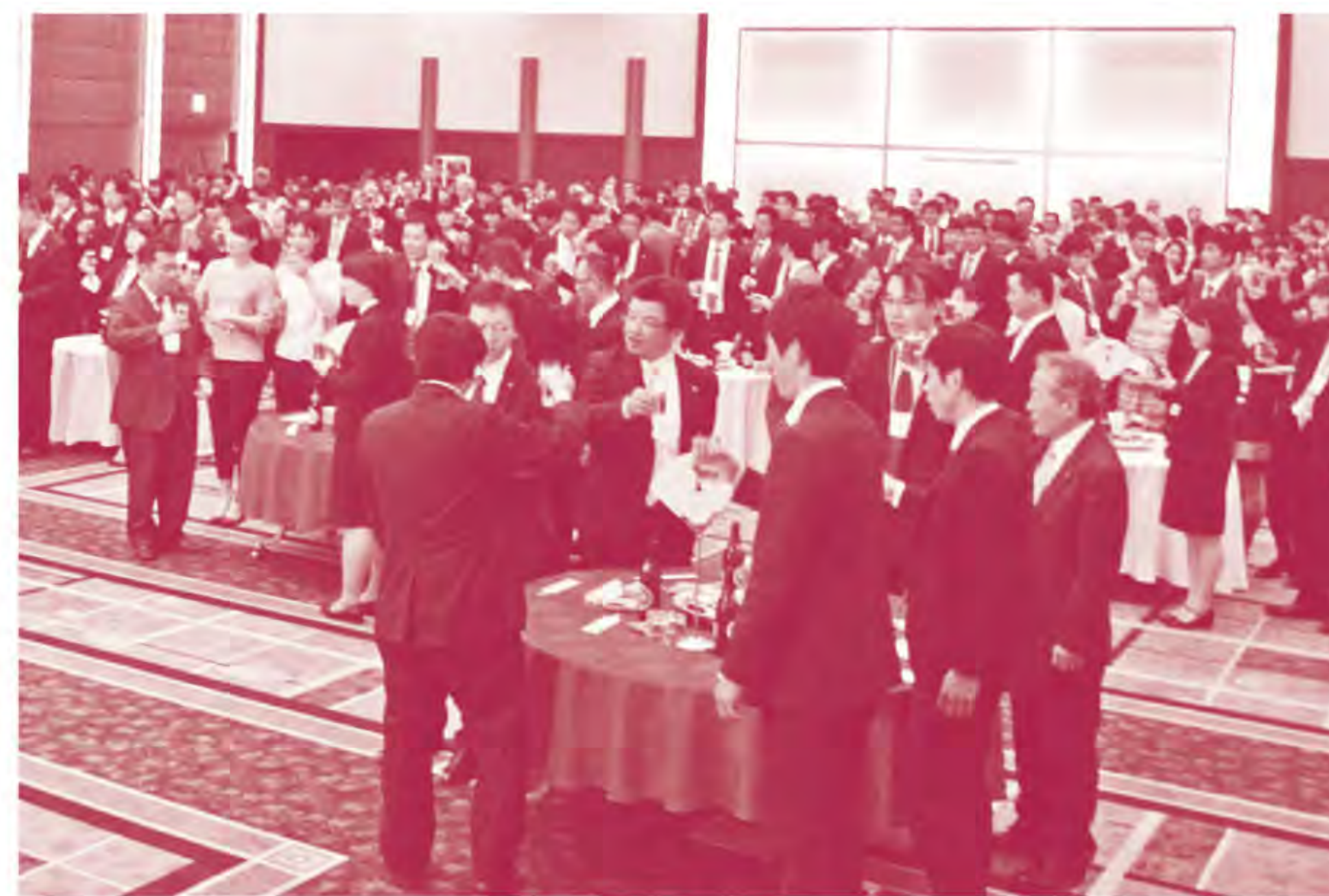
全役職員参加の懇親会を開催されました ↑

今は、高い能力が求められている時代です。若い職員を中心にしっかり教育し、よい方向へ導いていくことが私たち人事に携わる者の使命だと感じています。