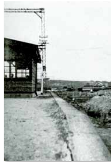
大阪鉄道（当時）上太子駅ホームに亀裂を生じ、内側が沈下（昭和11年2月21日河内大和地震）