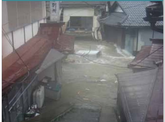
河道閉塞により浸水した野迫川村北股集落 (平成23年8月30日～9月4日紀伊半島大水害)