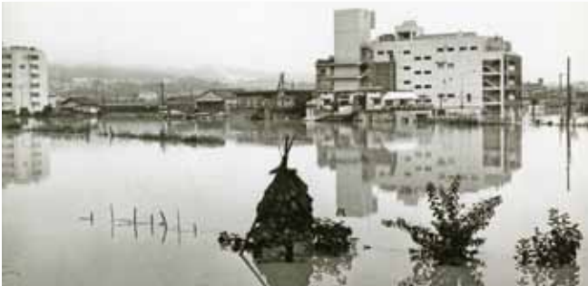
一面が湖水のようになった王寺町(昭和57年7月31日～8月4日大和川大水害・低気圧)