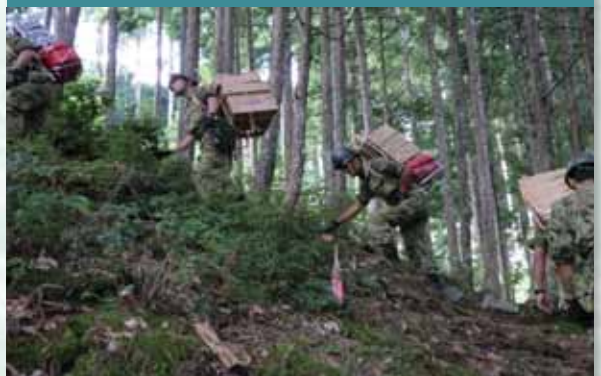
山越え陸路による物資搬送 (平成23年8月30日～9月4日紀伊半島大水害)