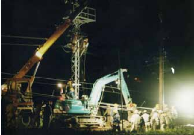
夜を徹し復旧作業を行う近鉄関係者・大和高田市磯野 (平成10年9月22日台風第7号)