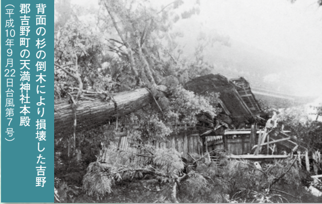
背面の杉の倒木により損壊した吉野郡吉野町の天満神社本殿 (平成10年9月22日台風第7号)