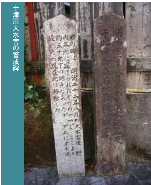
十津川大水害の警戒碑