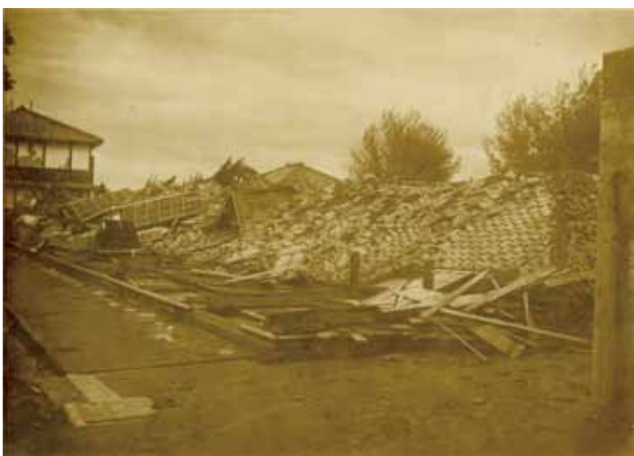
磯城農学校の倒壊 (昭和9年9月17～21日室戸台風・本文63ページへ)