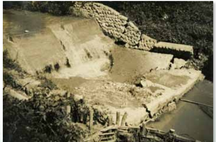
寿命川井堰決壊（昭和28年9月22～25日台風第13号）