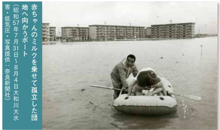
赤ちゃんのミルクを乗せて孤立した団 地へ向かうボート (昭和57年7月31日～8月4日大和川大水 害・低気圧)