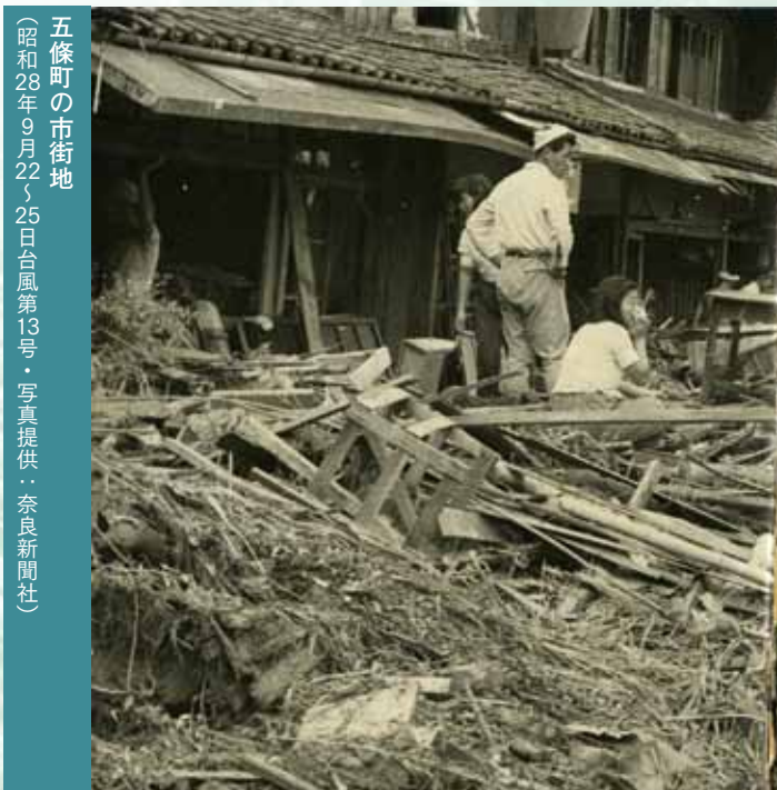
五條町の市街地（昭和28年9月22～25日台風第13号）