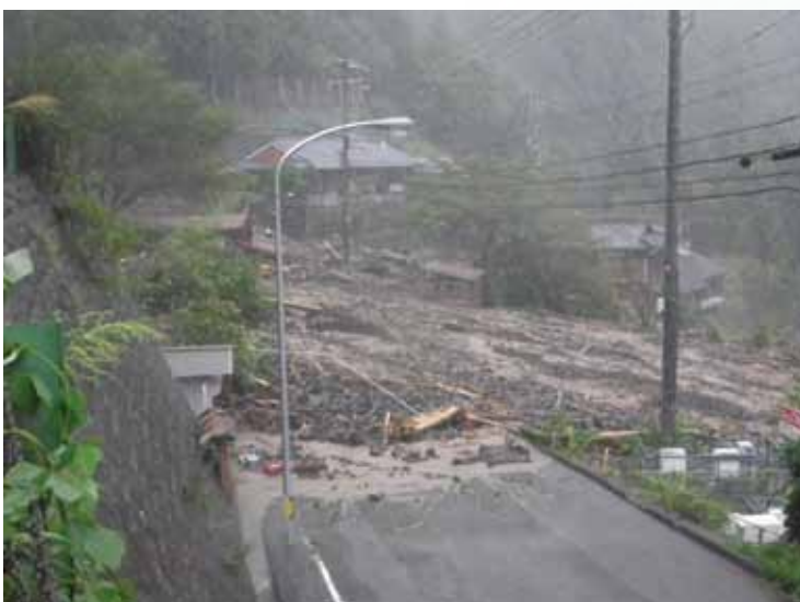
被災直後の十津川村長殿地区 (平成23年8月30日～9月4日紀伊半島大水害)