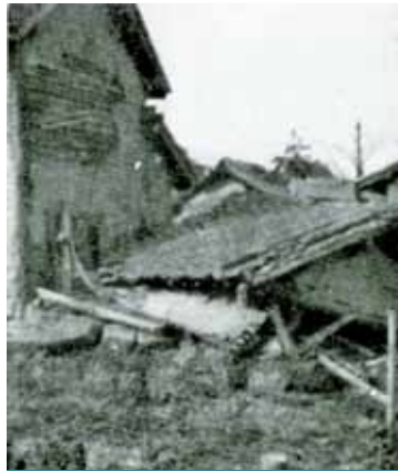
瀬南村南郷（現広陵町）の物置小屋の倒壊（昭和11年2月21日河内大和地震）