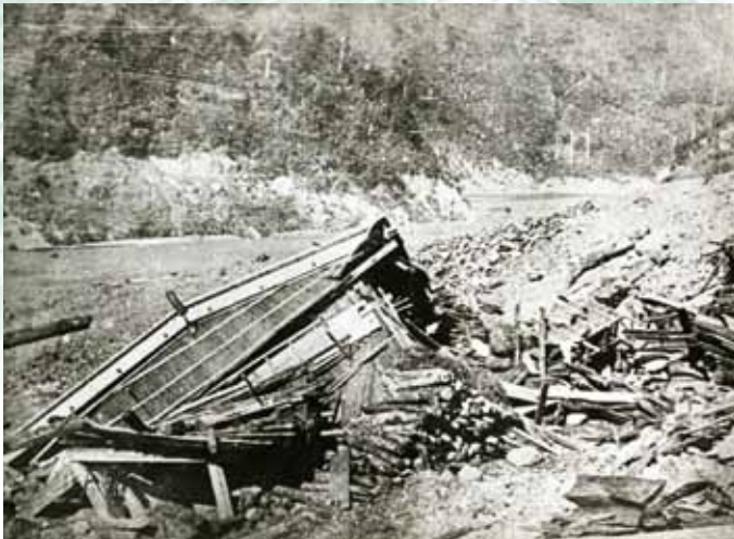
倒壊した家屋の様子 (明治22年8月18～20日十津川大水害・本文22ページへ・写真:『吉野郡水災誌』より)