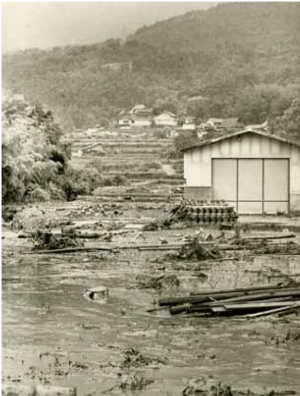
生駒市の新池決壊で土砂に埋まった水田 (昭和54年6月27～30日大雨)