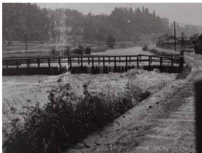
増水した川の水が橋を越えた東吉野村の川（昭和34年9月25～26日伊勢湾台風）