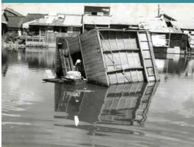
池の中に吹き飛ばされた奈良市の民家（昭和36年9月14～16日・第2室戸台風・本文133ページへ）