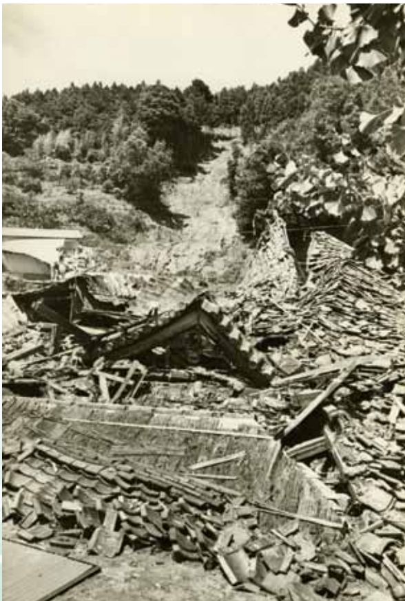
後方の山から土砂が崩れ、押し潰された常龍寺 (昭和57年7月31日～8月4日大和川大水 害・低気圧・本文149 ページへ)