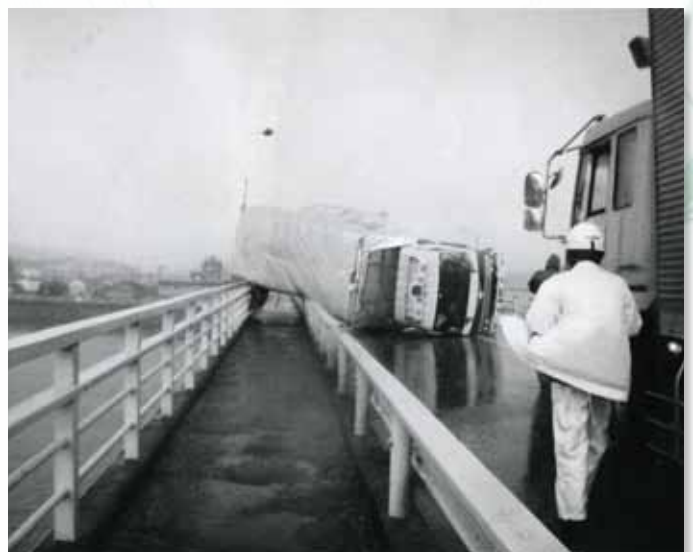
五條市の大川橋で強風にあおられて横転したトラック(平成10年9月22日台風第7号)