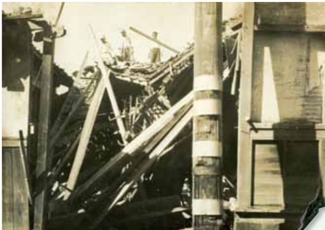
宇智吉野地区警察倒壊（昭和28年9月22～25日台風第13号・本文95ページへ）