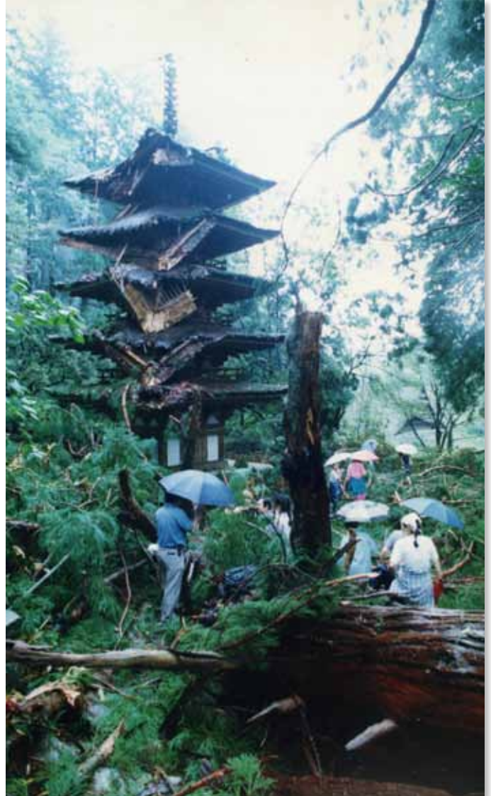
倒木で大きく破損した室生寺五重塔 (平成10年9月22日台風第7号・本文162ページへ)