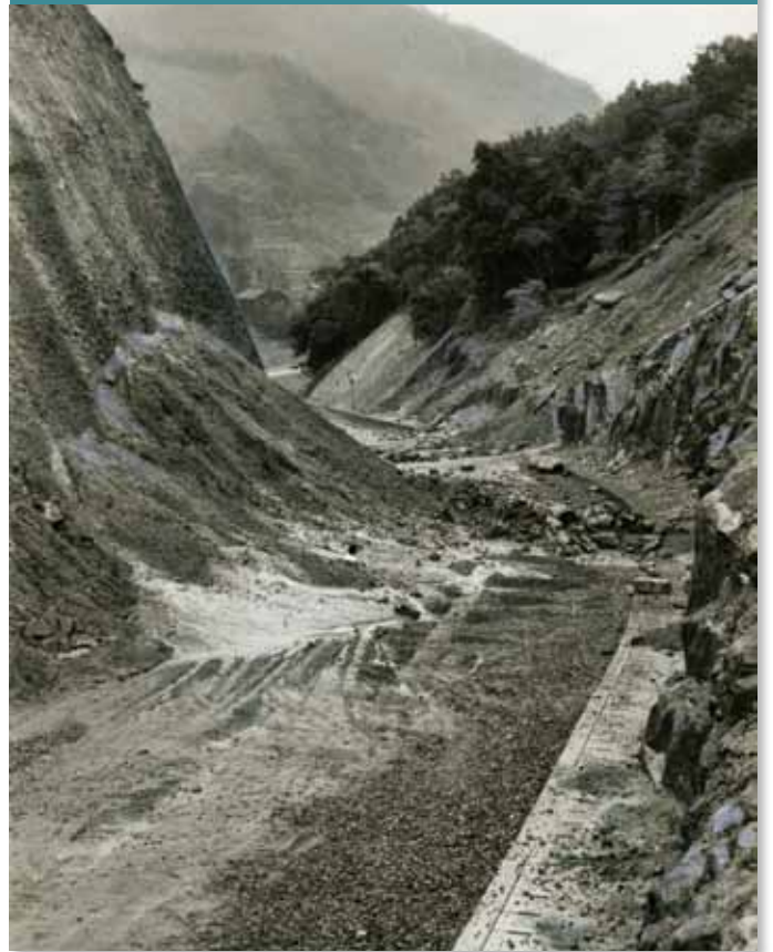
土砂崩れでふさがった室生村(現宇陀市)の国道165号 (昭和44年7月4～5日大雨・写真提供：奈良新聞社)