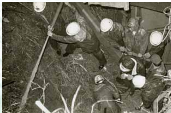
三郷町信貴山では放水して必死の 救出活動が行われた (昭和57年7月31日～8月4日大和川大 水害・低気圧)