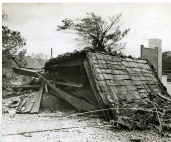
蓮長寺鐘楼（昭和36年9月14～16日第2室戸台風）