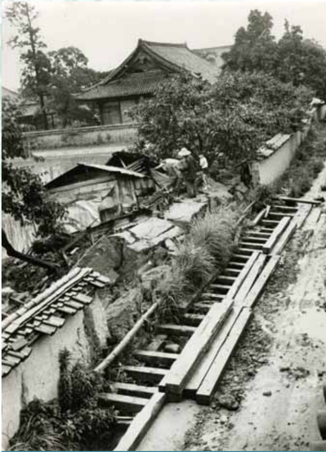
長雨で崩れた法隆寺の土塀 (昭和42年7月8～9日大雨)