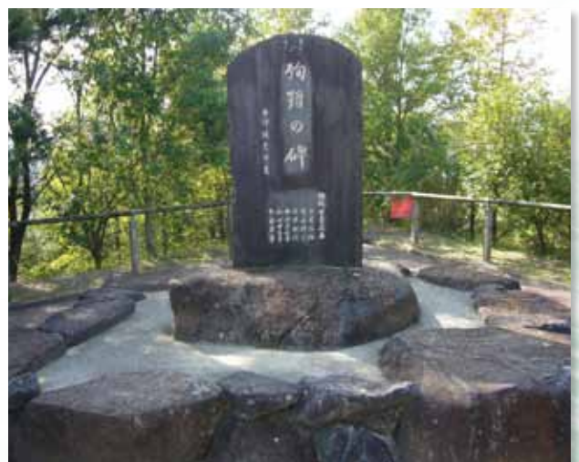
田原小学校児童殉難の碑 (昭和9年9月17～21日室戸台風)