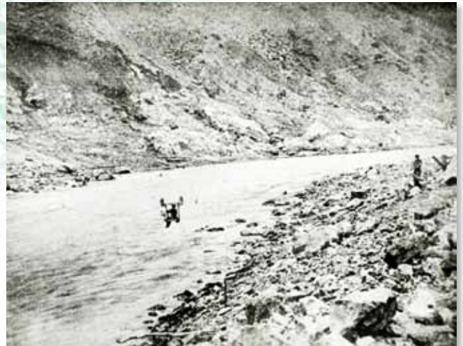
崩落した対岸へ鉄線を渡し、箱舟で川を渡る人 (明治22年8月18～20日十津川大水害・写真:『吉野郡水災誌』より)