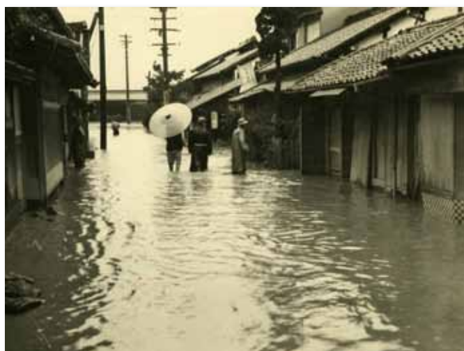
ひざ下まで浸水した川東村（現田原本町）（昭和31年9月25～27日台風第15号・本文102ページへ・写真提供：奈良新聞社）