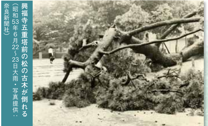
興福寺五重塔前の松の古木が倒れる (昭和53年6月22～23日大雨)