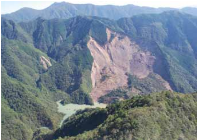
十津川村栗平の河道閉塞。高さ約450m、長さ約950m、幅約650mにわたって深層崩壊した (平成23年8月30日～9月4日紀伊半島大水害・本文170ページへ)