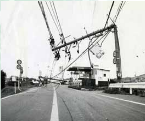
強烈な西風で北東側に倒れた香芝市鎌田のコンクリートの電柱の列 (平成10年9月22日台風第7号)