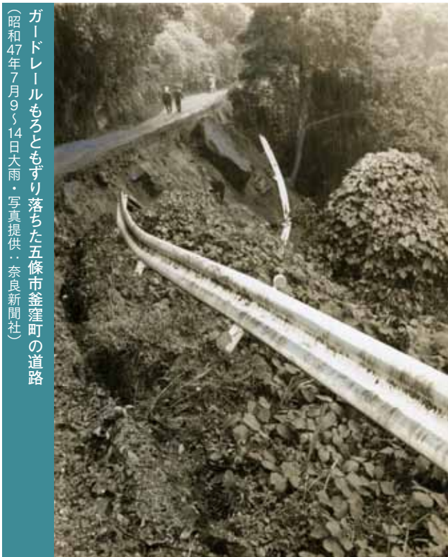
ガードレールもろともすり落ちた五條市釜窪町の道路 (昭和47年7月9～14日大雨)