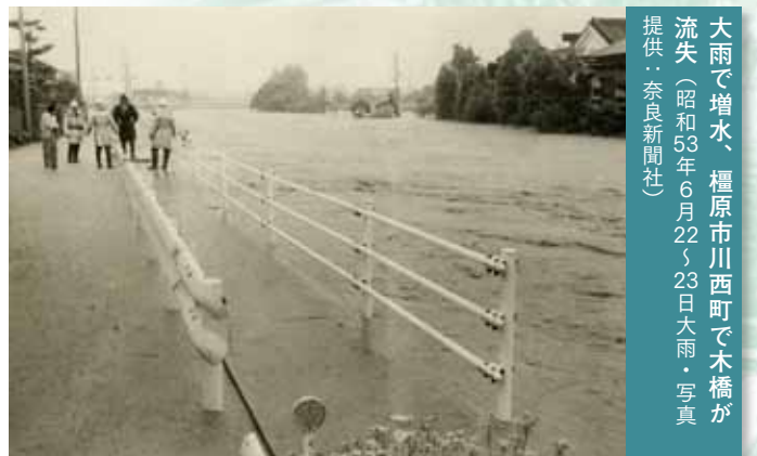
大雨で増水、橿原市川西町で木橋が流失 (昭和53年6月22～23日大雨)