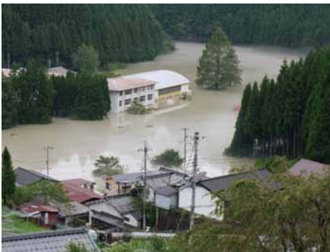
天川村坪内地区天川中学校 (平成23年8月30日～9月4日紀伊半島大水害)