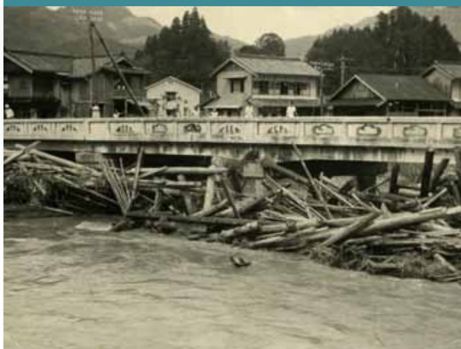
流木が押し寄せた榛原町（現宇陀市）天野橋（昭和34年9月25～26日伊勢湾台風・本文112ページへ）