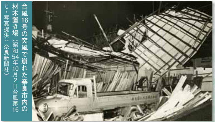
台風16号の突風で崩れた奈良市内の 材木置き場(昭和54年10月2日台風第16 号)