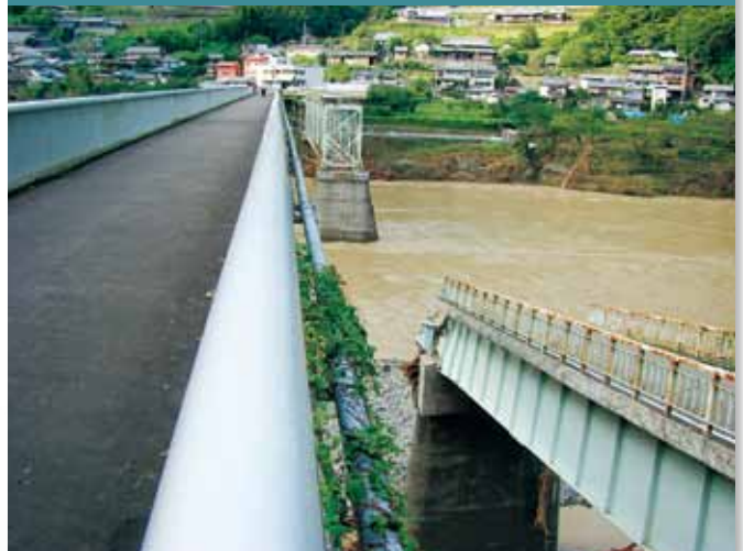
崩落した十津川村折立の折立橋 (平成23年8月30日～9月4日紀伊半島大水害)