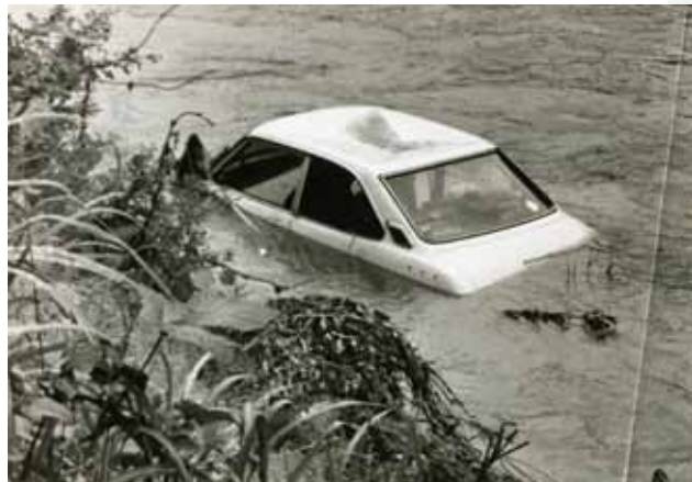
県南部を襲った豪雨による増水で流さ れた乗用車(昭和57年6月2日大雨)