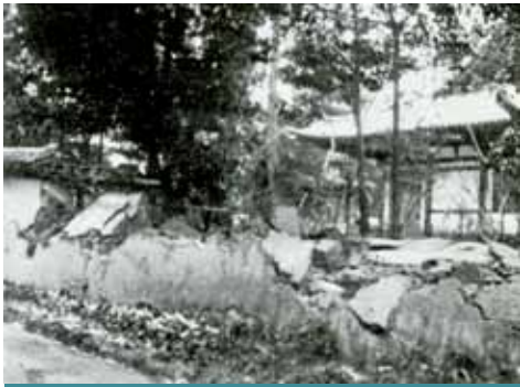
生駒郡都跡村西ノ京（現奈良市）薬師寺の土塀の崩壊（昭和11年2月21日河内大和地震・本文73ページへ・写真提供：気象庁）