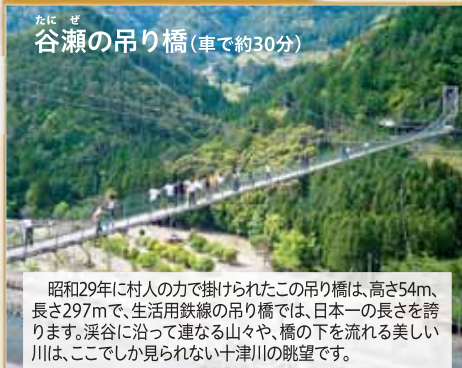
谷瀬の吊り橋(車で約30分)

昭和29年に村人の方で掛けられたこの吊り橋は、高さ54m、長さ297mで、生活用鉄線の吊り橋では、日本一の長さを誇ります。渓谷に沿って連なる山々や、橋の下を流れる美しい川は、ここでしか見られない十津川の眺望です。