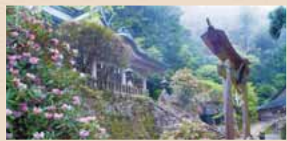
玉置神社(車で約50分、下車後徒歩約10分) 玉置山の標高1000m付近に鎮座する玉置神社は、第十代崇神天皇の時代に創建されたと伝えられています。社務所・台所は国の重要文化財に指定されており、本殿裏手の樹齢3000年の御神木は一見の価値あり。

昭和29年に村人の方で掛けられたこの吊り橋は、高さ54m、長さ297mで、生活用鉄線の吊り橋では、日本一の長さを誇ります。渓谷に沿って連なる山々や、橋の下を流れる美しい川は、ここでしか見られない十津川の眺望です。