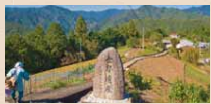
世界遺産 熊野参詣道小辺路(車で約20分) 2004年7月「紀伊山地の霊場と参詣道」としてユネスコ世界遺産に登録された、高野山と熊野本宮を結ぶ全長72kmの聖なる祈りの道。十津川村の中でも世界遺産が通る果無集落は、「にほんの里100選」にも選ばれています。