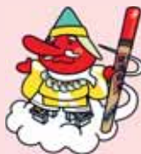
キャンペーンキャラクター サルタヒコくん