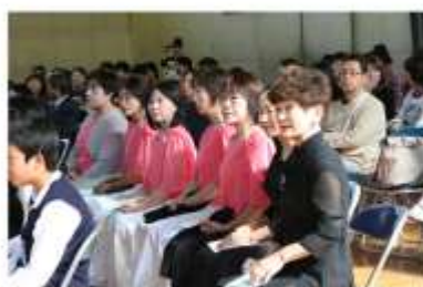
(M・Sコーラスの交流)