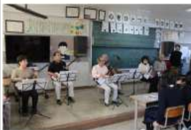
(三味線クラブとの交流)

治道公民館のクラブと治道小学校が互いの活動を通して交流することで、学校教育と地域での生涯教育が共に充実発展していくことを願う。