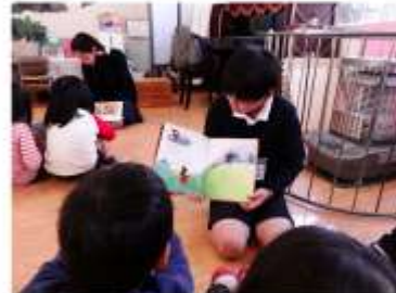
(絵本の読み聞かせ)