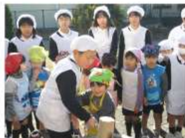
(こども園とのおもちつき大会)