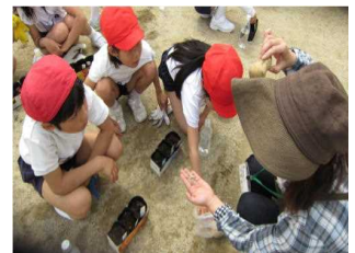
②ポットに土を入れて、 へちま、ひまわり、ひ ょうたんの種をまきまし た。 (ひょうたんの種は山本コーデ ィネーターにいただきました)