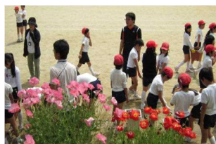
④みんなで、完成した プランターを運びます