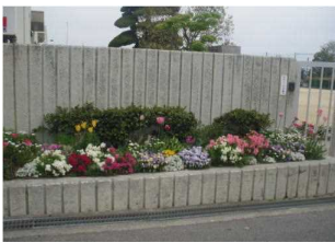
南門 4月の様子 新入生を迎えます