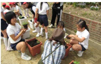
③グリーンカーテン用プラ ンターを作るグループとひ まわり、松葉ボタンを植え るグループにわかれて作 業