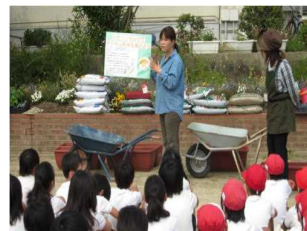
5月21日 ① 4年生の理科の授業 の時、「ひまわりを咲 かせて、東日本に笑顔 を届けよう」と東北の 話をしてもらう。