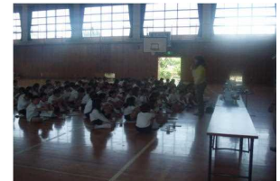
②作業の後、NPO法人 かつらぎエコネット ワーク（環境課）に よる環境学習