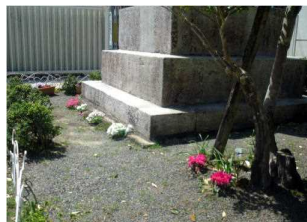
平和塔のまわり 3月に6年生と一緒に 石を磨きました (辻コーディネーター 指導のもと)