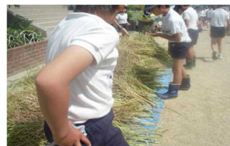
5月23日 ① 菜の花の刈り取り後、