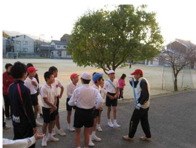
駅伝大会へ向けての練習