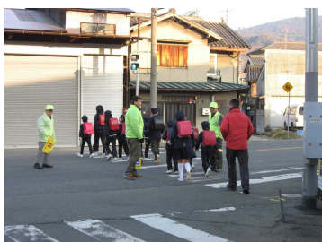
登下校の見守り活動