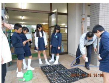
デイジー・ピオラのセル苗の移植