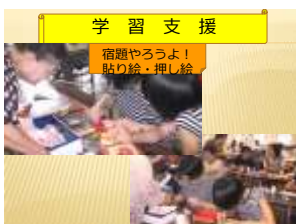
学習支援 宿題やろうよ! 貼り絵・押し絵