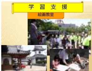
学習支援 絵画教室

個性を尊重しながら、心を表出するように寄り添い、絵を描き上げる楽しさを味わった。