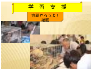
学習支援 宿題やろうよ! 絵画