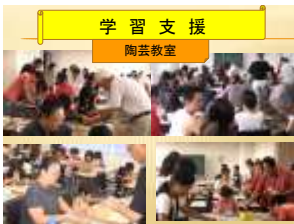
学習支援 陶芸教室

ボランティアに対してめざす大人像 ・子どもたちや保護者との関わりを通して、双方から学び、自分自身を見つめ、さらに生涯学習への意欲を高め活動する。