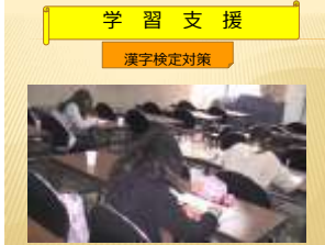
学習支援 漢字検定対策

防災について「いざという時、どう行動すればよいのか!」を高田消防署の署員の方から学んだ。