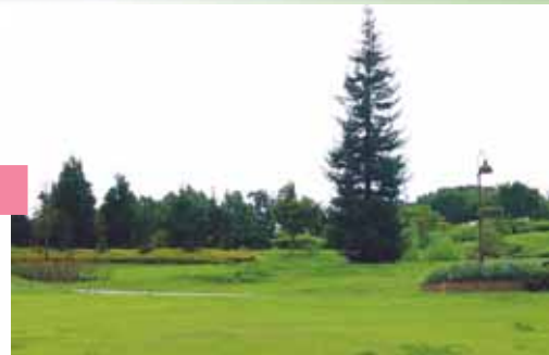
眺望を楽しむ場の整備(王寺町 明神山)