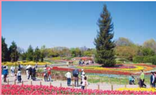
公園施設での彩り等整備(馬見丘陵公園 チューリップフェア)