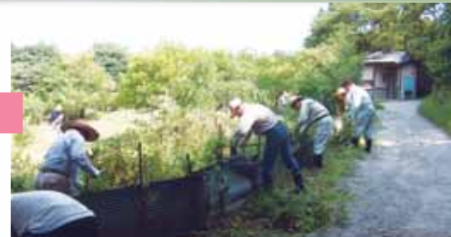
眺望の活用、森林とのふれあいの推進(大門ダム)