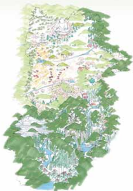
『一つの庭』のイメージ

豊かな自然や歴史文化遺産に恵まれ、古代に都が置かれた奈良は、日本の始まりの地であり、「日本の庭」の発祥の地でもあります。