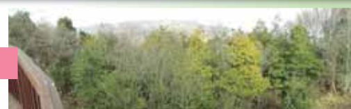
遊休農地を活用した魅力の向上(山の辺の道周辺)