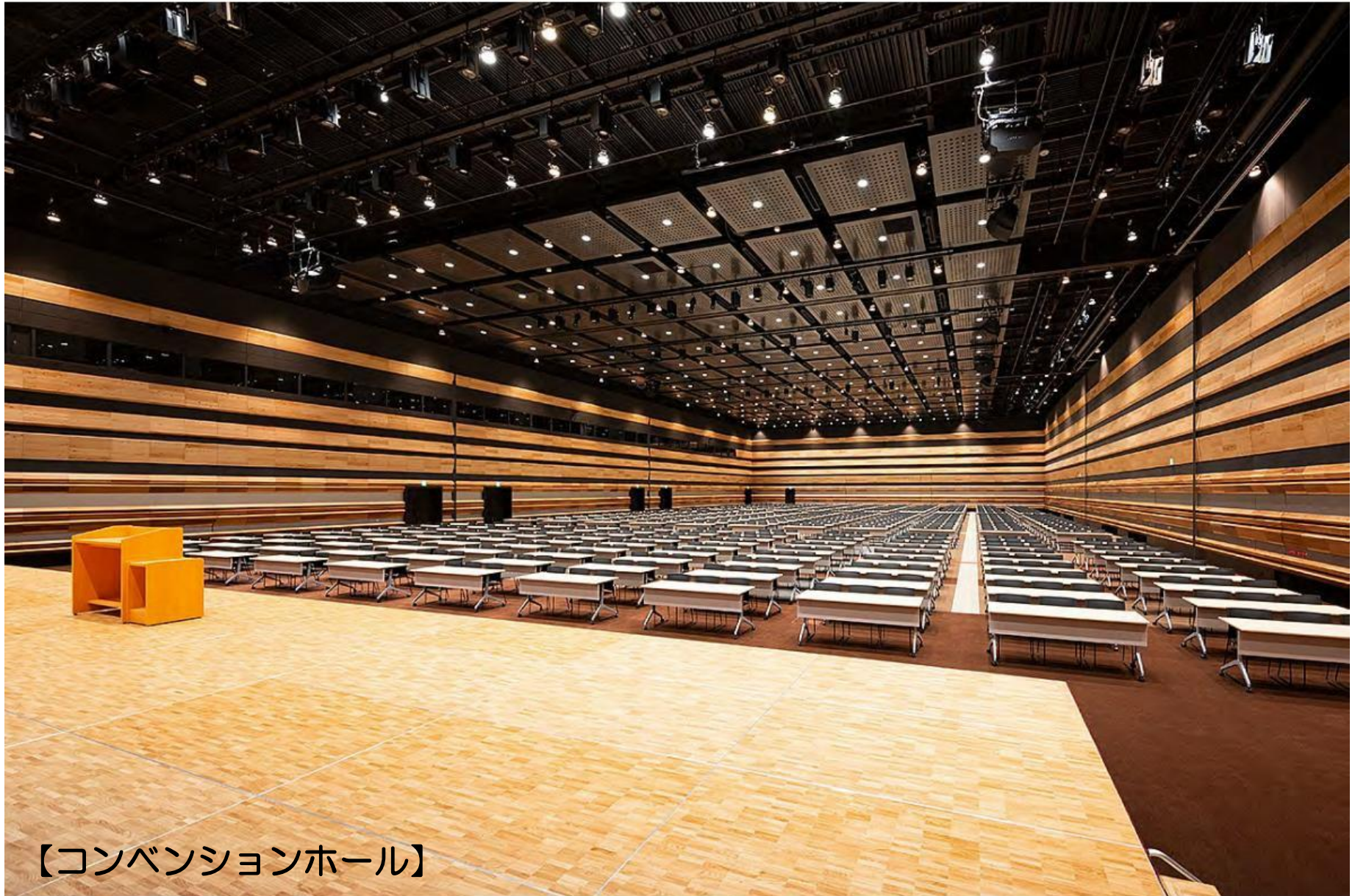
【コンベンションホール】