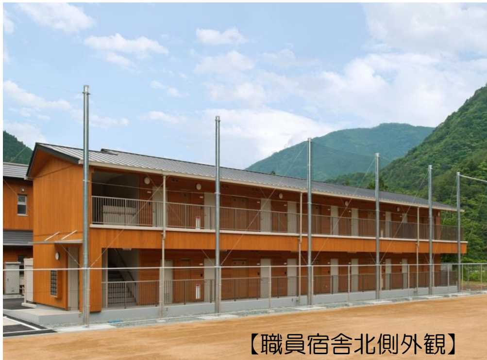
【職員宿舎北側外観】