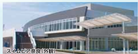
スイムピア奈良(外観)