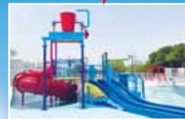
ファミリープール複合遊具