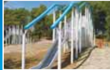
子ども広場大型複合遊具

公園(子ども広場など) 野球場、テニスコートのほか子ども広場には4つの大型複合遊具などがあります。