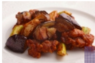
大和丸なすと鶏肉の辛味噌炒め (中国料理 桃谷樓)