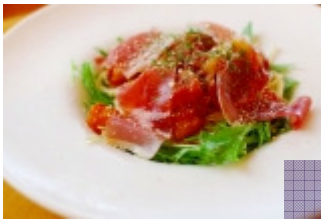
大和丸なすと生ハムの冷製トマトソースのパスタ (mamma)

「眺望のいいレストラン」に認定されている10店では、「大和の旬の食材フェア」と題し、スタンプラリーの期間中、季節ごとに、こだわりの奈良県産食材を使用したスペシャルメニューを提供します。8月1日～9月30日は大和丸なすを使ったメニューを提供します。スタンプラリーとともに楽しみください。