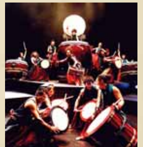
「和太鼓・倭」によるオープニングパフォーマンス(9/13 県新公会堂)

伝統芸能や県民参加ステージ、大学祭見本市など県主催イベントをはじめ、県内各地で、「音楽」「演劇」「芸能」「舞踊」「美術」「映画」などさまざまな分野の文化芸術団体等が主催するおよそ400の催しが、奈良の秋を彩ります。