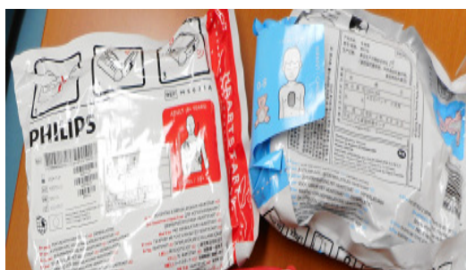
AEDパッド（大人用、小児用）