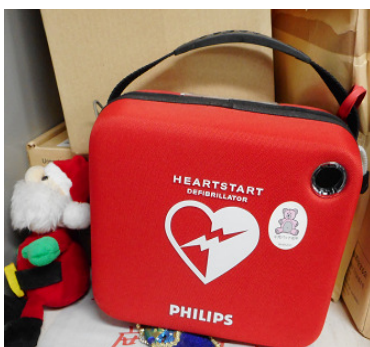
1階執務室にて設置