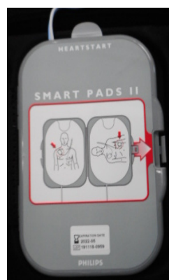
事務室受付前にAED設置表示