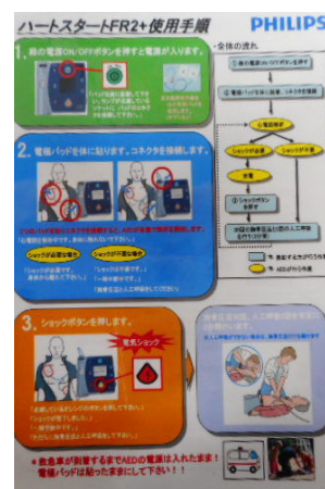
AED点検手順書及び使用手順書