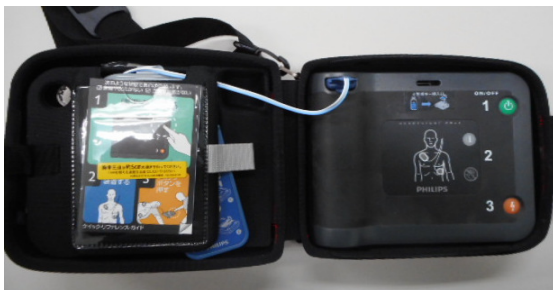
本庁 健康・安全教育課内に設置