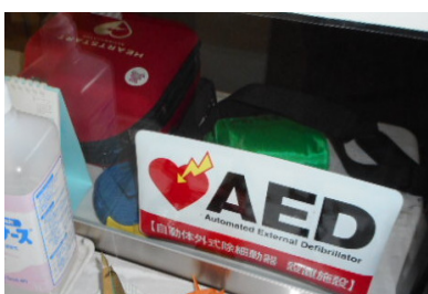
事務室受付前にAED設置表示