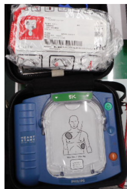
事務室受付前等にAED設置ステッカーを表示