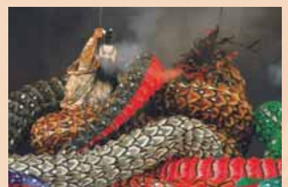
島根の神楽(イメージ)