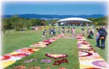
馬見フラワーフェスタ2013より