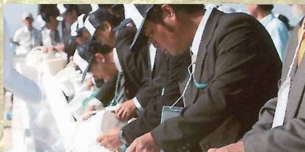
放流・歓迎行事イメージ写真(第33回熊本大会のようす)

時11月16日(日) 所おたき龍神湖(川上村) 招待者による「アユ」「アマゴ」の放流と、水上での歓迎行事を行います。