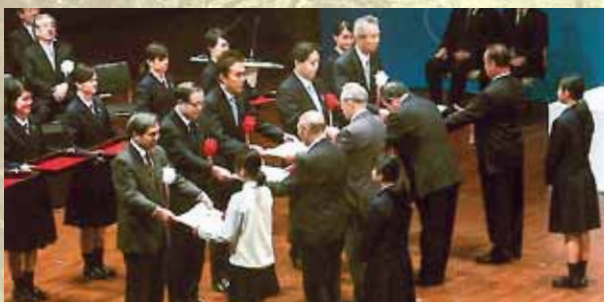
式典行事イメージ写真(第33回熊本大会のようす)

時11月16日(日) 所大淀町文化会館あらかしホール 豊かな海づくりのために功績のあった団体や作品コンクール入賞者の表彰、大会決議等を行います。