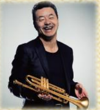
日野皓正クインテット with 渡辺裕之