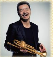
日野皓正クインテット with 渡辺裕之