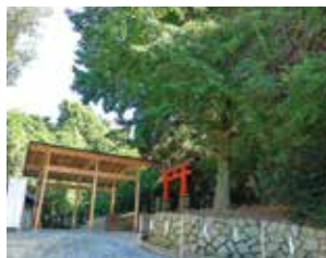
御蓋山浮雲峰遙拝所

これまで非公開、参入禁止であった東回廊外に設けられた御蓋山浮雲峰遙拝所での参拝と御本殿参拝、140年ぶりに公開される後殿があらたに特別参拝の順路に組み込まれて実施されています。