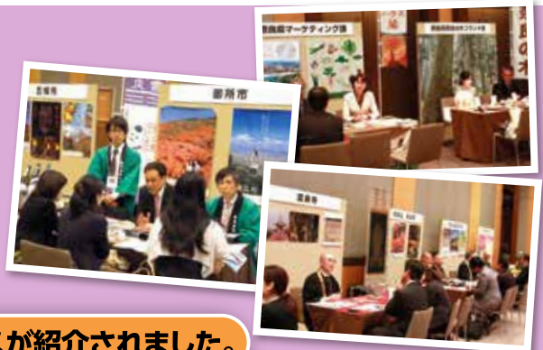
プロモーション会のようす

商品説明会は13社26人、プロモーション会は49社100人の方にご来場いただきました。