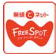
FREE SPOTのWi-Fi利用はこのマークが目印