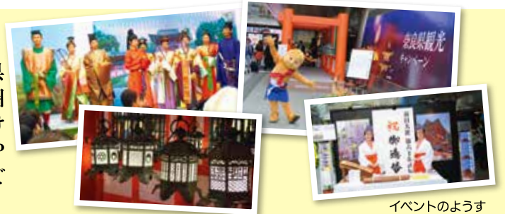
イベントのようす

5月15日・16日に六本木ヒルズ(東京都)で、奈良県観光キャンペーンのオープニングを大々的に首都圏で発信するため、記者発表会や、一般のお客様向けに春日大社回廊を再現し万燈籠を実施するなどのPRイベントを開催しました。2日間で約1万人の方にご来場いただきました。