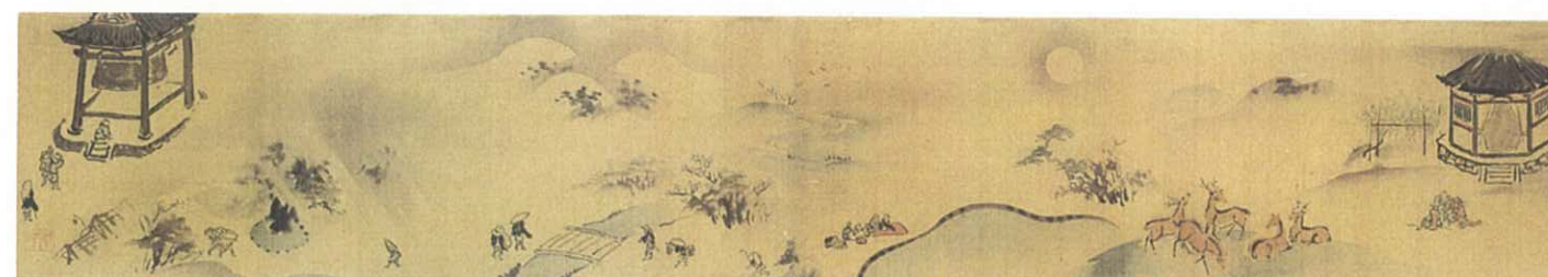
南都八景図(部分) (古礪明誉筆)