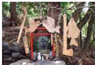
東吉野村木津川の山の神