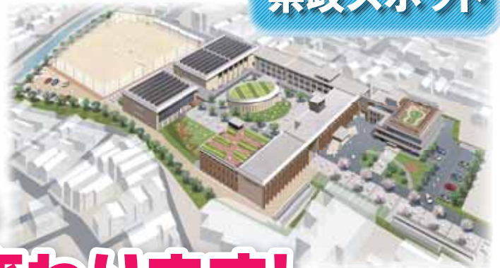
施設整備のイメージ図

シルクロード経由で伝わったとされる「唐草模様」のイメージで「NARA」の文字をデザイン。奈良の枕詞「青丹よし」の色である青色（緑色）と朱色、冠位十二階の最上位の色である紫色で「最高学府」に相応しいロゴを表現。