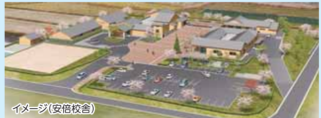
イメージ(安倍校舎)

実学教育を通じて、農産物の生産、調理、加工、流通などを担う次世代の「食」と「農」のトップランナーを育成します。