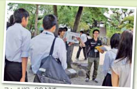
フィールドワークのようす