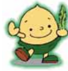
「みどりの募金」キャラクター どんぐりくん

県では「みどりの月間」を中心に、「緑の募金」活動や「緑化啓発PR展」を行います。4月29日には、馬見丘陵公園で「奈良県緑化コンクール表彰式」を行い、花の苗を配布します。ぜひお越しください。緑の募金へのご協力をお願いします。