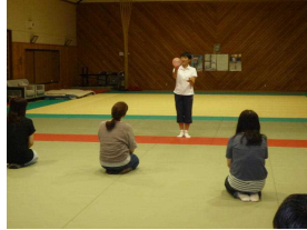
(ストレスマネジメント)

親子人権教育講演会、ストレスマネジメント演習を実施した。登下校時の安全指導あるいは「あいさつ運動」、パートナーシップ活動として学校美化を実施した。