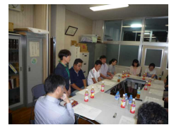
(コミュニティ協議会)

学校、家庭、地域が「参画・協働」し、地域の教育力の向上を図るために、コミュニティ協議会において、実施計画の具現化の検討を行い、以下の取組等を実施した。