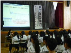
(親子人権教育講演会)