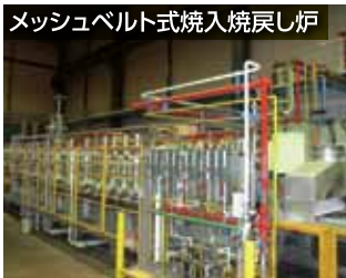
メッシュベルト式焼入焼戻し炉

製品の搬送をメッシュベルトのコンベア形式で行い、焼入(硬く強くする)、焼戻し(硬さを調整し、粘りのある金属にする)などの処理を一貫して行うことができます。