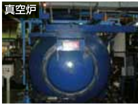
真空炉 空間を真空にし、加熱・冷却する装置。

そうですね。ネジは例えば建築関係や重機など、さまざまな製品に使われますし、どのような製品に使われるものかによって、必要とされる硬さや粘りが異なるんです。そういったお客様の幅広いニーズに答えられるように、他の会社にはないオーダーメイドの設備を投入しています。国家資格である技能士の資格を取得し、高度な技術をもった社員がいることも当社の強みですね。技能向上により、「匠」にもなれる業種だと思っています。