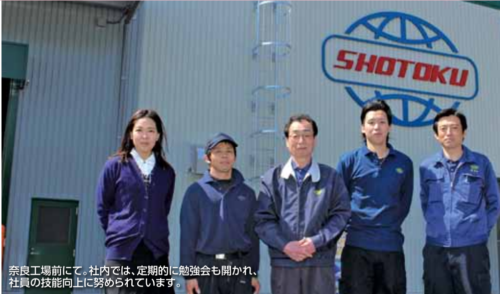
奈良工場にて。社内では、定期的に勉強会も開かれ、社員の技能向上に努められています。