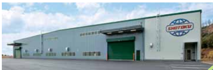
今年2月から本格稼働している平屋建て1,000㎡の奈良工場。(敷地面積:10,000㎡)

奈良工場は、今後も新しい設備を設置していける余裕があります。熱処理の後工程である表面処理も自社で一貫して行えるような態勢にできたら、とも考えています。さらにお客様や社会に貢献できる企業を目指して、「熱処理加工と言えれば『松徳工業所』と言われるようになりますね！