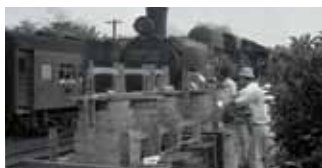
郡山駅から金魚の出荷