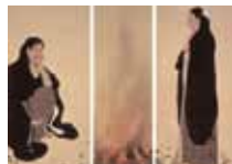
「焚火」横山大観 熊本県立美術館蔵

■ ギャラリートーク 要観覧券 5/2(土)・5(祝)・23(土) 14:00～ ■ ミュージアム・コンサート 5/10(日)・24(日) 13:30～・15:30 出演:奈良マンドリンギター合奏団