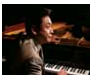
横山幸雄◎ ミュージックエンターテイメント

指揮:阪 哲朗、ピアノ:横山幸雄 奈良フィルハーモニー管弦楽団 [曲目]ラフマニノフ ピアノ協奏曲第2番、 チャイコフスキー 交響曲第4番