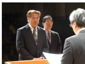
グッド・学校コミュニティ表彰 (高田西中コミュニティ)