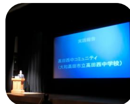
実践報告 (高田西中コミュニティ)