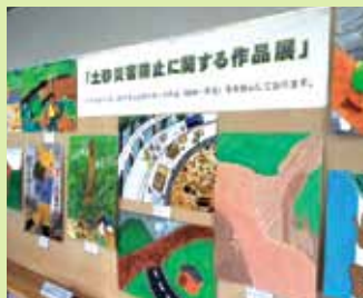
昨年開催された作品展のようす

県内では、ポスターの掲示や作品展の開催、道路情報板での情報発信など、土砂災害防止に関する啓発活動を実施しています。