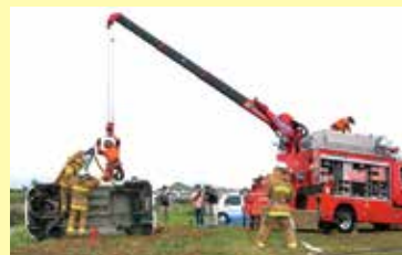
昨年の奈良県防災総合訓練のようす

問 県防災統括室 〒630-8501 奈良市登大路町30番地 ☎0742-27-7006 FAX 0742-23-9244 ✉ bosai-event@office.pref.nara.lg.jp