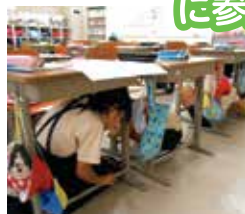
昨年のナラ・シェイクアウトのようす(桜井市立安倍小学校)