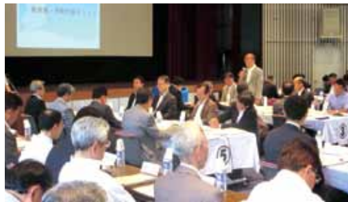
サミットのような様子

県では、各市町村を取 り巻く課題について、お 互いの課題や状況を把 握し解決に導くため、全 国的にも例を見ない取 り組みとして、知事と市 町村長が意見交換を行 う、奈良県・市町村長サ ミットを平成21年度か ら実施しています。