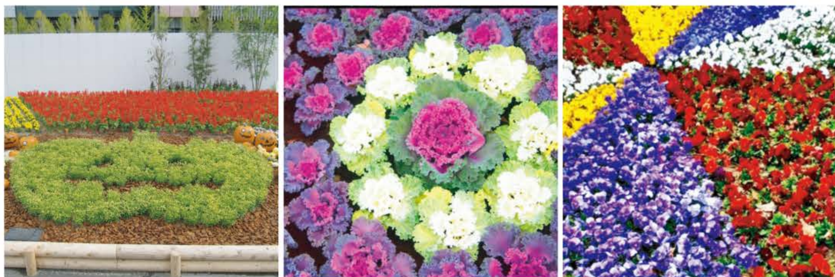
▲アキランサスとウッドチップの毛氈花壇