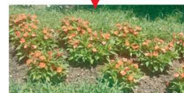
成長するにつれて株間が埋まります