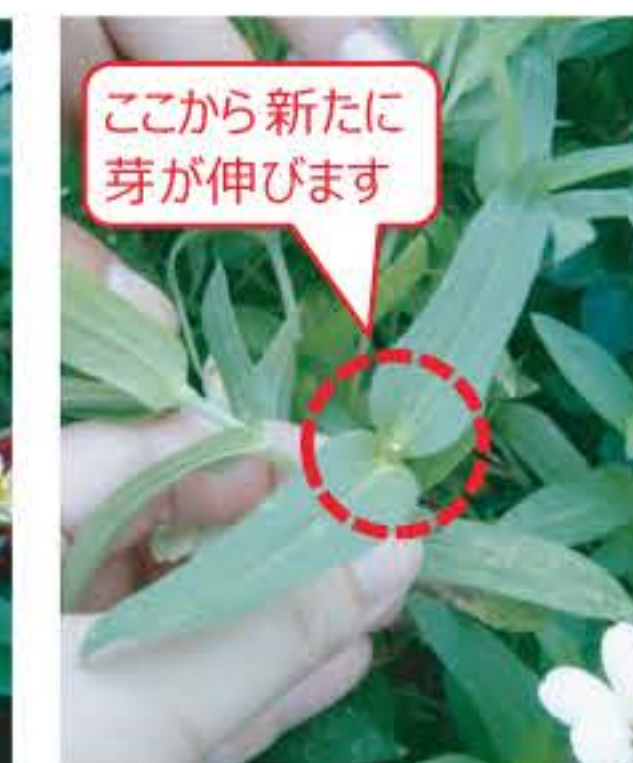
ここから新たに芽が伸びます