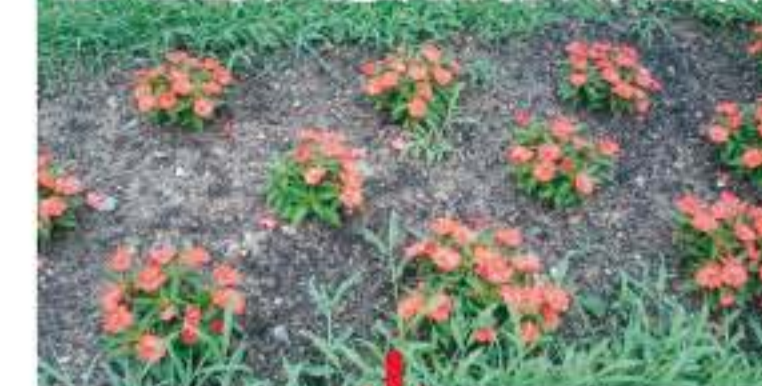
25cmピッチで植えたインパチェンス

植えたい植物が、どのくらいの大きさまで成長するかによって異なります。例えばインパチェンスは、成長したときに株同士が少し触れあう程度をイメージし、20～30cm程度の植え付けピッチとします。フラワーフェスタなどのイベント用に花壇を作る場合は、短期間で完成形の花壇にする必要があるため、既に成長している苗を通常よりも狭いピッチで植え、地面が見えないようにする工夫をしています。毛氈花壇では、植え付けピッチを狭くした方が模様がきれいに見えます。