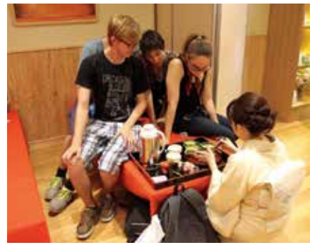
抹茶体験のようす

奈良県猿沢インは、奈良県を訪れる外国人観光客が、奈良のさまざまな観光情報を入力し、県内周遊ができるよう、観光地と外国人観光客とをつなぐゲートウェイ(中継地)を目指します。奈良県を訪れる外国人観光客が、滞在中、安心して快適に旅行できるようにサポートをしていきます。また、海外に向けた情報発信拠点としての機能も担います。