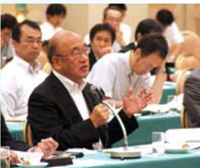
県選出国會議員への説明会のようす

また、それに先立ち、7月11日に奈良市内で、知事、県内市町村長、県議會議員が出席し、県選出国會議員に対して、提案・要望内容の説明会を開催しました。